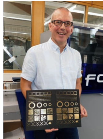
Dekorative Metallic-Effekte kommen bei Logos, Schriften, Flächen und auch Bildern hervorragend zur Geltung.