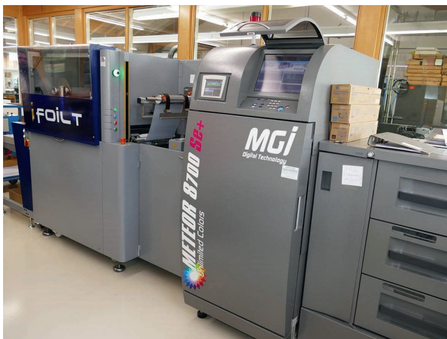
Die moderne MGI Meteor Unlimited Colors 8700 Se+ mit Inline-Folierung kombiniert professionellen CMYK-Druck mit digitaler Folienprägung.