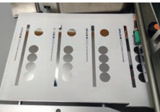
Druckbogen mit Folienprägung in der Auslage.

Kopierschutz: Schriftzug "COPY", "unerlaubte Kopie" oder individuell